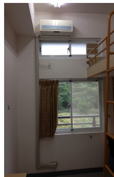
女研究生宿舍外觀，室內冷氣機