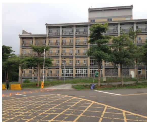
女研究生宿舍外觀