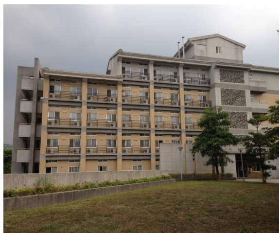
男研究生宿舍外觀