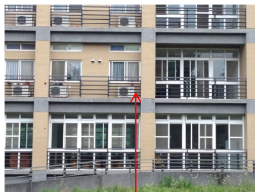
女研究生宿舍外觀，分離式冷氣機室外機

惟本項不使用冷氣機房間分散各樓層，建議考量建築物溫差效應，低樓層B1(或至1F)不設置冷氣機，則可供拆移使用數量有55(或至113)部，有利管理及外部景觀。